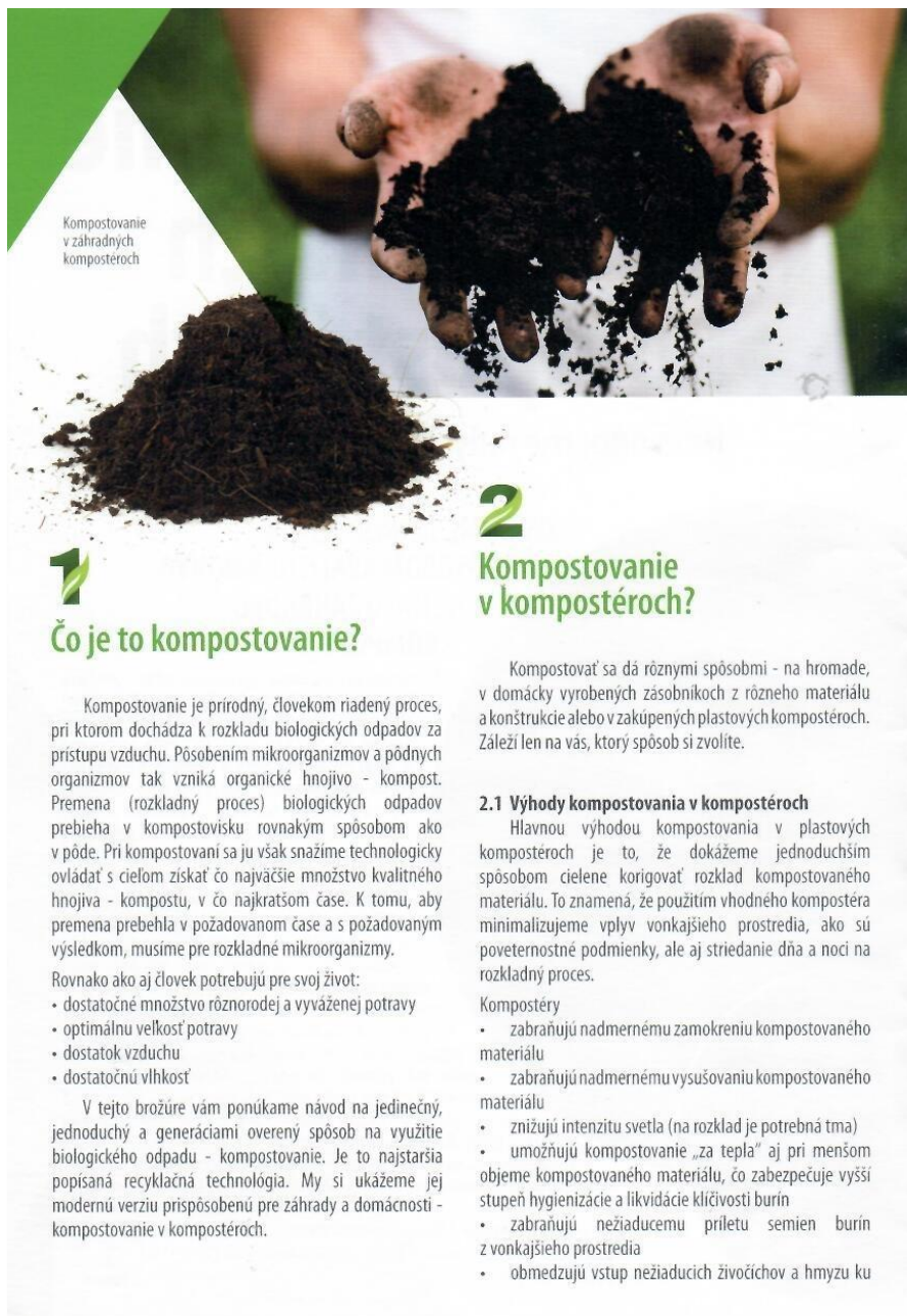
Kompostovanie v záhradných kompostéroch